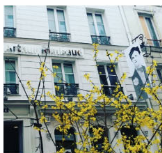
La façade de l'hôtel Arthur Rimbaud à Paris

Arthur Rimbaud va avoir son hôtel à Paris, dans le 10 e arrondissement, 6 rue Gustave-Goublier, près de la gare de l'Est qui a vu débarquer le poète de Charleville-Mézières en 1871, à l'invite de Verlaine. L'inauguration du lieu est programmée jeudi 21 avril, déclarée journée mondiale de la poésie.