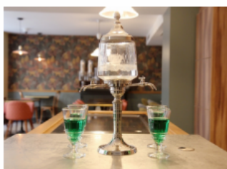
La fontaine à absinthe dans le bar.

Côté chambres, elles sont associées à un poème ou un lieu où a séjourné « l'homme aux semelles de vent » et chacune valorise un texte qui est encadré au mur. Une invitation à lire et relire Rimbaud dans un lieu qui propose également de nombreuses rencontres autour de l'univers du livre.